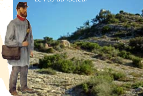
Le Pas du facteur

Le Pas du Facteur qui se trouve entre le Mont Aurélien et le Mont Olympe à l'Ouest de Pourcieux a une histoire assez singulière :