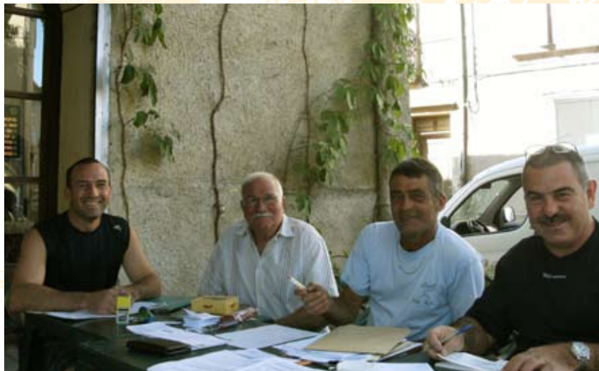
vente des cartes de chasse