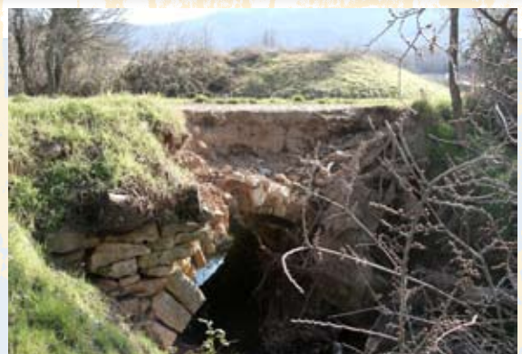
Le pont avant et après réparation

Le pont de la Chapelle Saint Martin 1 sur lequel passe un chemin rural reliant la station d'épuration à l'Arc s'est partiellement effondré. Un gros arbre déraciné par l'action conjuguée du vent et de la pluie a entraîné une partie du tablier de l'ouvrage dans le ruisseau des Avalanches. Le SABA (Syndicat d'Aménagement du Bassin de l'Arc) a été chargé du suivi technique des réparations qui s'élèvent à 10 716€ pour une restitution à l'identique.